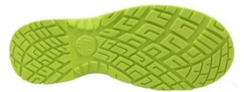
Suela Antiestática + Resistente a los hidrocarburos