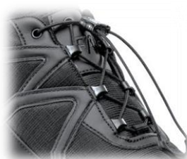
Ganchos reforzados no metálicos – ajuste rápido