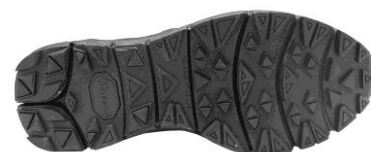
Suela Vibram con compuesto MEGAGRIP