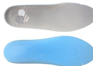
Plantilla extraíble y transpirable