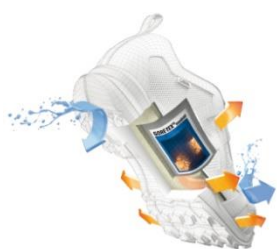
Suela transpirable GTX SURROUND

Cumple con EN ISO 20347:2012 OB+SRA+HRO+E+WRU+WR