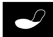
PLANTILLA ANTI- PERFORACIÓN FLEXIBLE